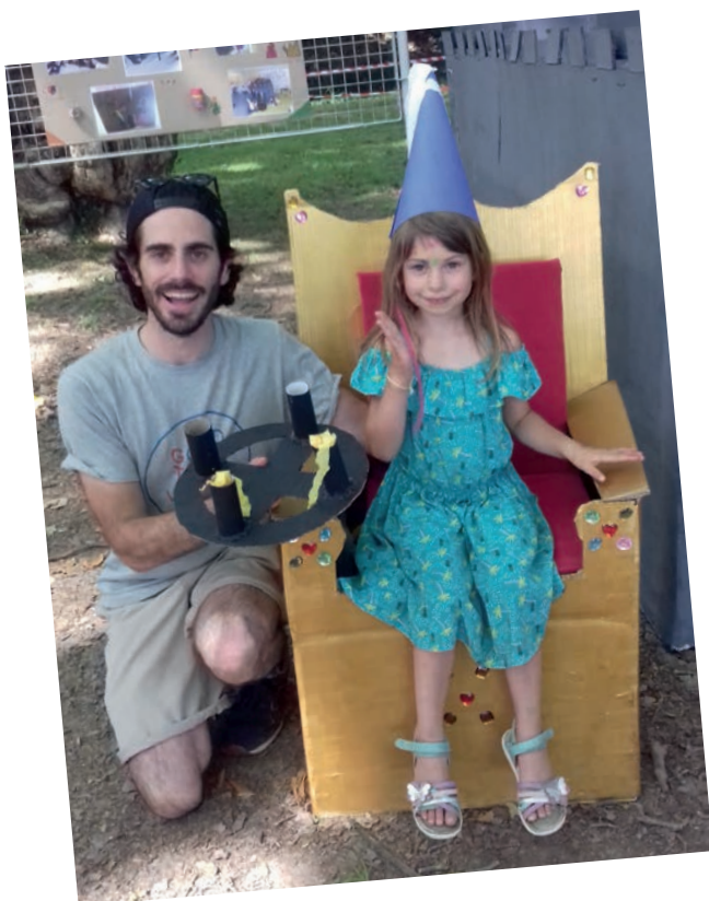
LA JOIE DES PETITS, DES PARENTS ET ...DES GRANDS PARENTS