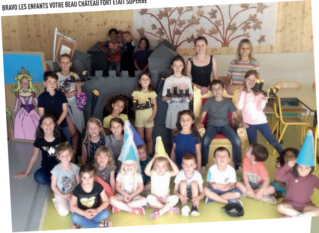
BRAVO LES ENFANTS VOTRE BEAU CHÂTEAU FORT ÉTAIT SUPERBE