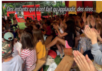
Des enfants qui n'ont fait qu'applaudir, des rires...