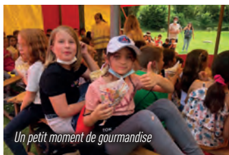
Un petit moment de gourmandise