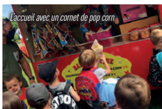
L'accueil avec un cornet de pop corn